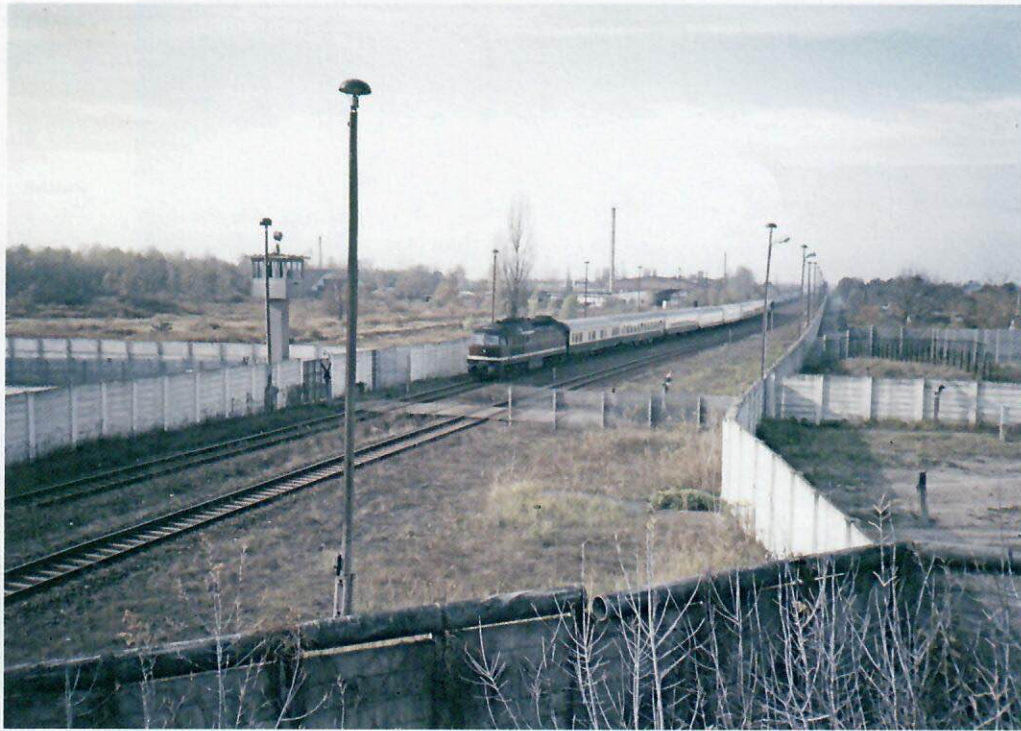
Durch das prächtige Spalentor kamen die Verkehrsgüter aus dem Elsass in die Stadt. ▶