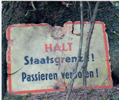
Im Wald verrottendes Schild mit DDR-Wappen und Inschrift ▶

«Wir führen gerne die Geschichte aus weiter Vergangenheit zu uns heran. Das ist verführerisch und auch gefährlich, denn es hätte immer auch ganz anders verlaufen können.»