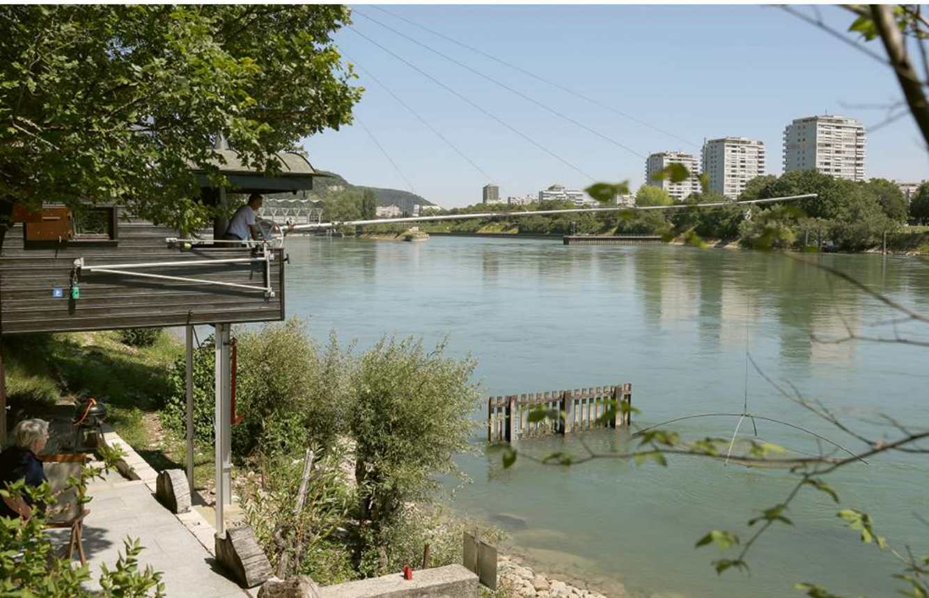
Vom Fischergalgen hat man eine wunderbare Aussicht auf den Rhein, das Stauwehr und das Birsfelder Sternfeld.