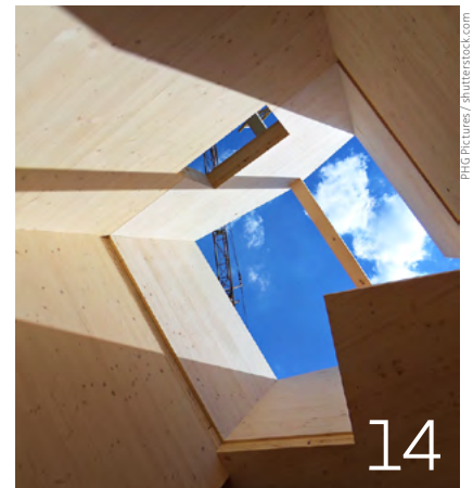
Neues altes Bauen mit nachhaltigen Materialien in Basel

Titelbild Collage: Gisela Burkhalter, Fotos: anat chant/DonniYudhaPerkasa, shutterstock.com