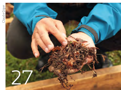
Ökologische und resiliente Landwirtschaft ist möglich.