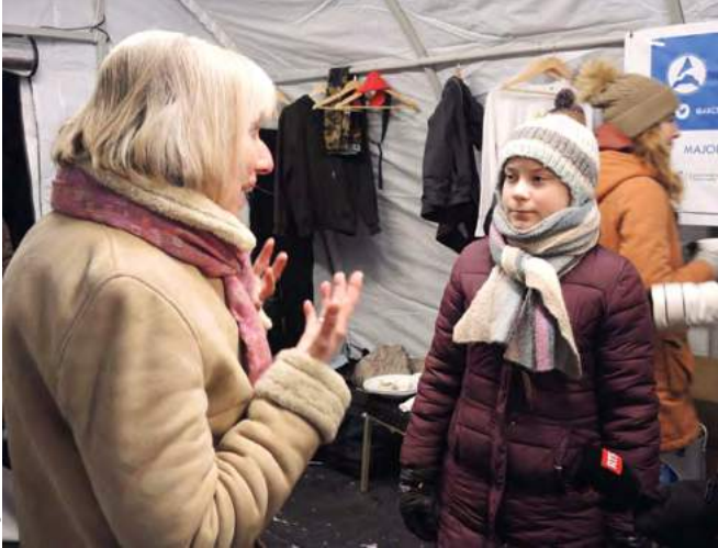
◀ Mit Greta Thunberg am WEF in Davos

«Das wäre eine schöne Schlagzeile gewesen: «Alte Grosis von der Polizei geschnappt!»»